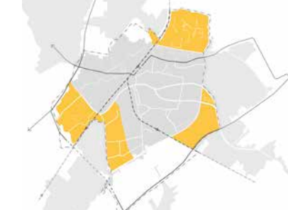
Groen en luw

Belangrijke aandachtspunten • Levendig en aantrekkelijk 'Hart van de wijk' als basis voor sociaal inclusieve stad • Zet in op klimaatadaptieve maatregelen • Bedrijfsterrainen optimaal benutten voor bedrijvigheid met behoefte aan milieuruimte • Bijzondere aandacht voor demografische en sociale ontwikkeling