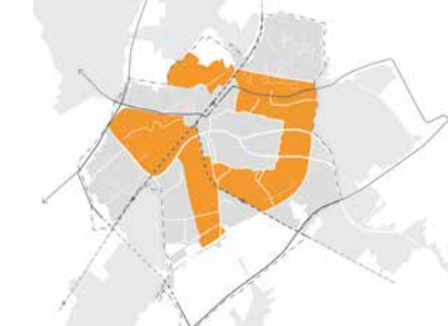
Groen en luw

5. Zet in op het realiseren van gemengde werkgebieden en nieuwe concepten Groen en luw Het leefmilieu 'groen en luw' bestaat uit de groene en relatief luwe wijken die aan de rand van de gemeente liggen, vaak tegen het landschap aan.