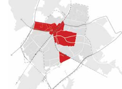
Stads en levendig

Belangrijke aandachtspunten 1. Verdichten van de stad door het bouwen van woningen voor een mix aan doelgroepen 2. Streven naar een levendige mix verbindend element tussen groene plekken en gebieden 3. Groen-blauw raamwerk als verbindend element tussen groene plekken en gebieden 4. Mobiliteitshubs ontwikkelen om duurzame mobiliteit te stimuleren